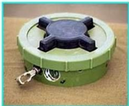
Рис.1 Общий вид мины ПМН-2

ПМН-2 Противопехотная мина нажимного типа